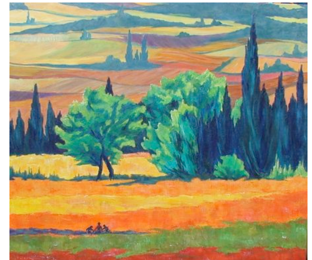
« Eclat »