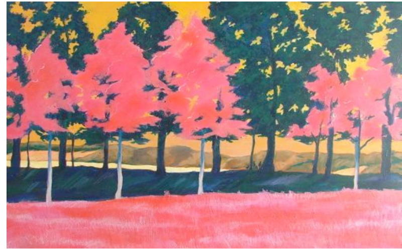
« Danse »

La peinture est une voie, une exploration du mystère de la vie.