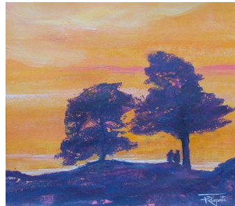
« Bienveillance »